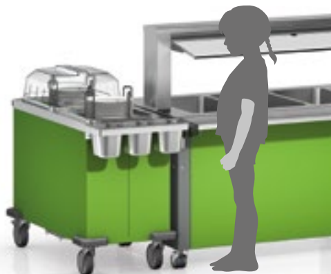
Оптимальная высота раздачи (750 мм) для детей младше 10 лет

Для самых маленьких: ориентированная на детей система раздачи блюд, BASIC LINE Kids, благодаря более низким модулям раздачи подходит для обслуживания детей. Для высоты раздачи 750 мм имеются две модели диспенсеров тарелок B.PRO без подогрева в безопасном исполнении: