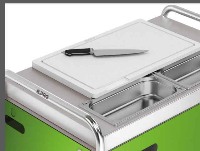
Planche à découper en matière plastique La planche à découper repose de manière stable sur le plan de travail. Elle est également parfaitement adaptée aux récipients GN intégrés. Pratique : elle est dotée d'une rainure à jus pour l'écoulement dans les récipients GN du plan de travail.

Pare-haleine pour chariot de service Grâce au pare-haleine disponible en option, votre chariot de service 8 x 5 peut également être utilisé pour la distribution mobile et flexible. Le pare-haleine est extrêmement léger et peut être installé à tout moment sur presque tous les SW 5 x 8.