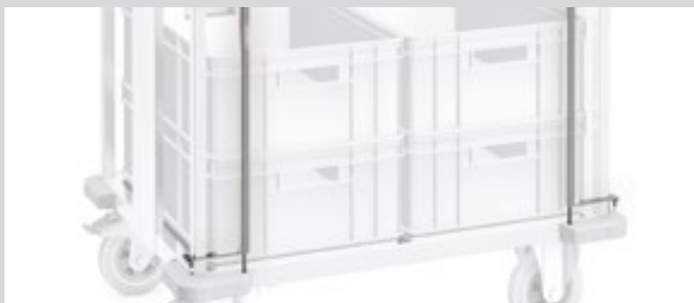
TWE 6 x 4 mit optionaler beidseitiger Durchschubsicherung