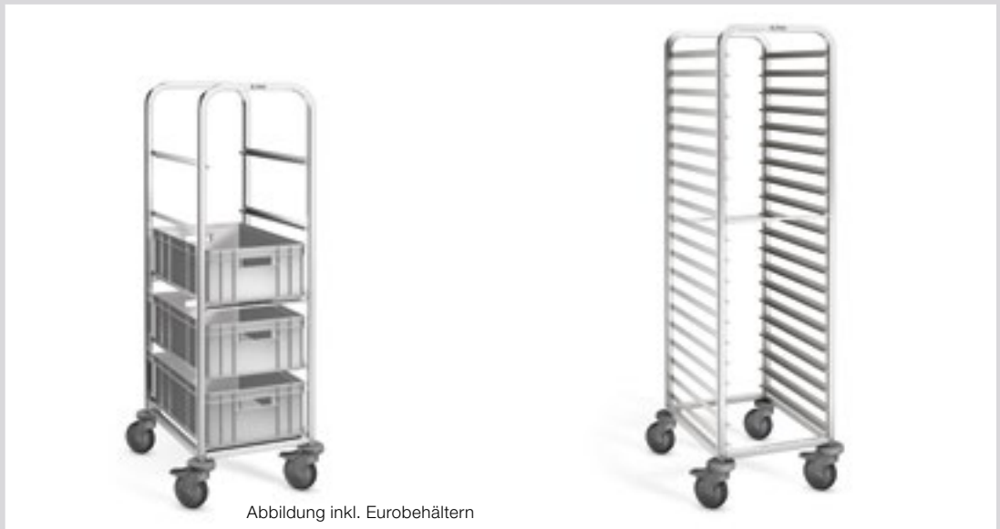
Abbildung inkl. Eurobehältern