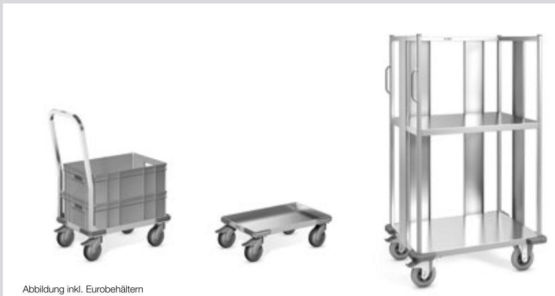
Abbildung inkl. Eurobehältern