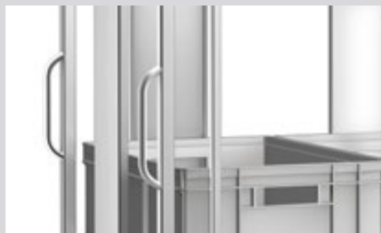
TWE 6 x 4 mit ergonomischem Schiebegriff