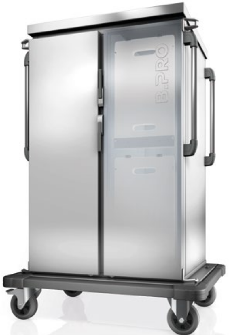
TTW-PK 20-115 DZE Tablett-Transportwagen zur passiven Kühlung mit Eutektischen Platten, doppelwandig, isoliert, für Euronorm-Tabletts

Für Sie bedeutet das: Kein unerwünschter Luftaustausch zwischen den Fächern, besserer Temperatur-Erhalt, schnelle Zugänglichkeit der Kühlelemente, leichtere Reinigung und bessere Hygiene – weil B.PRO einfach weiterdenkt.